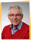
Johannes Rau Niedermennig